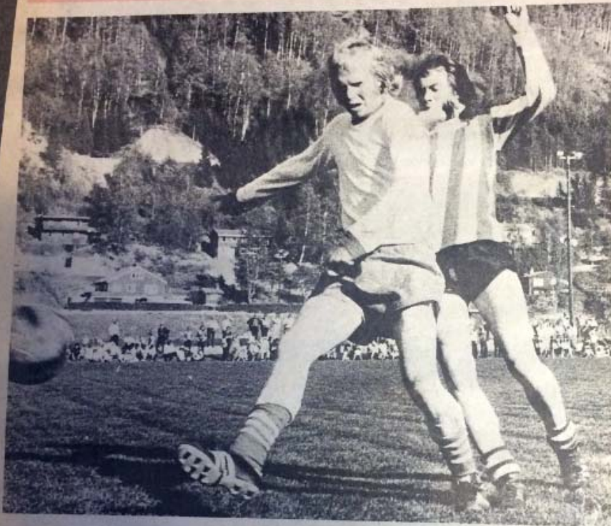
Valsetakt og kamp om ballen på Otta-gresset i går, der hjemmelaget og Kvam delte poengene.

Både Kvam og Otta stiller høyt i år, og sluttresultatet da de to lagene møttes til dyst i Øya søndag, ble da som seg hør og bør uavgjort. 2-2 ble det, og det må først og fremst kvamværene prise seg lykkelige over. Otta ledet lenge 2-0, og bare i en periode i begynnelsen av 2. omgang var kvamværene på talefot med hjemmelaget.