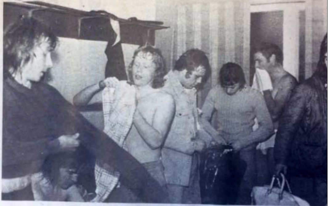
En innbitt Otta-gjeng etter siste treningskvelden.